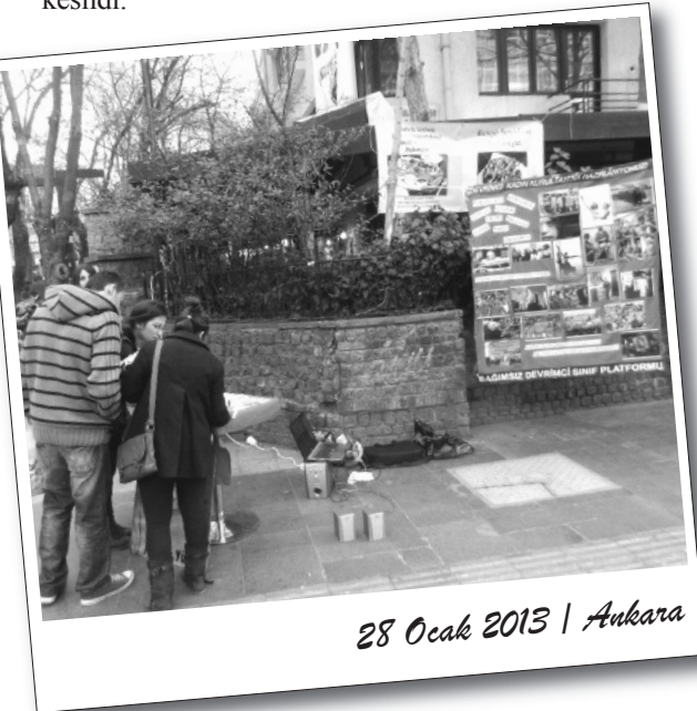
28 Ocak 2013 | Ankara

Bursa'da faaliyetler afişlerin yapılmasıyla devam etti. Afişler merkez, İnönü Caddesi, Atatürk Caddesi, Cumhuriyet Caddesi, Fomara Meydanı, Fevzi Çakmak Caddesi, Kıbrıs Şehitleri Caddesi ve Ulubatlı Hasan Bulvarı, Namazgah ve Gökdere hattına yapıldı. Afiş çalışması sırasında sınıf devrimcilerine para cezası kesildi.